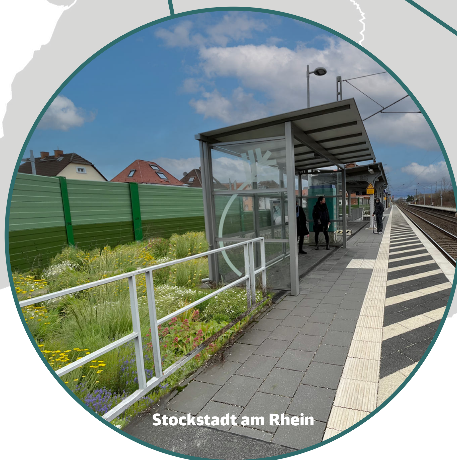
Stockstadt am Rhein